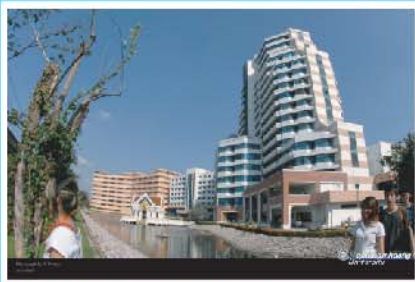
บัณฑิตวิทยาลัย อาคารทำขวัญชั้น 3 โทร. 02-310-8560-65 www.grad.ru.ac.th

เดือนนี้ เป็นเดือนวันแม่แห่งชาติ ผู้หลักผู้ใหญ่ในบ้านของเรา ทั้งพ่อแม่ ปู่ย่าตายาย มีความสำคัญ เป็นร่มโพธิ์ ร่มไทร ดูแลท่านดีดินะครับ ยิ่งในสถานการณ์โรคภัยระบาดรุนแรง พวกท่านเหล่านี้คือกลุ่มเสี่ยง กลุ่มเปราะบาง เราจึงควรดูแลตัวเองให้ดีกว่าคนอื่นด้วย เพราะหากเราติดโรค แล้วนำเชื้อไปสู่ท่านเหล่านั้น ก็ย่อมอาจเกิดความสุขสูญเสียตามมา รักษาสุขภาพกันนะครับ แล้วพบกันใหม่ ฉบับหน้า