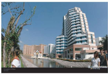
บัณฑิตวิทยาลัย อาคารทำชัยชั้น 3 โทร. 02-310-8560-65 www.grad.ru.ac.th

28 กรกฎาคม ทรงพระเจริญ ยิ่งยืนนาน ตลอดกาล นิรันดร์ มั่นสมัย พระปกเกล้า ปกกระหม่อม จอมทัพไทย เทิดพระองค์ พระทรงชัย ทรงพระเจริญ